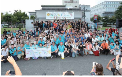
スタッフ・出演者たち

プロアマのミュージシャン総勢300組500人が街中でライブを行う「ストリートライブin高崎」も、こどもも