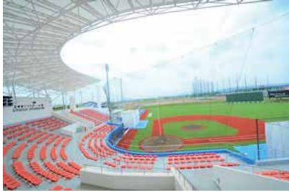
宇津木スタジアム

本年6月に浜川運動公園にオープンした「宇津木スタジアム」にて、8月30日(金)～9月1日(日)の3日間に渡り、国際女子ソフトボール大会が開催された。