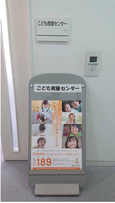
こども救援センター

10月1日より、高崎市役所本庁舎4階に「こども救援センター」を新たに開設。こども救援センターは、新たな課題として創設し、虐待対応担当と家庭支援担当の2担当制としている。虐待対応の迅速化を図るとともに、よりきめ細かな支援を