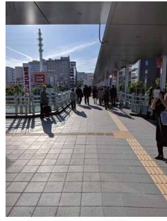
東口ペDESTリアンデッキ

9月20日に高崎芸術劇場が開館した。同劇場のこけら落とし公演として、群馬交響楽団と高崎第九合唱団がベートーヴェンの「交響曲第九番」を披露した。 高崎駅東口から劇場に向かう屋根付きのペDESTリアンデッキも同時に開通し、高崎駅東口側の活気が大きく向上した。劇場イベント開催日には高崎駅西口の市営駐車場「ウエストパーク200」(旭町)と劇場を往復する無料送迎タクシーを運行し、駐車場を持たない現状の交通利便性対策も講じる。また、来年度には民間企業による大型駐車場が同劇場付近に建設される予定となっている。