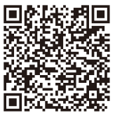
賛成討論 録画配信

去最高を更新しており、経済活性化施策の成果が着実に税収の増加につながっていると考えられる。さまざまな施策に対し選択と集中による配分で本市をもっと元気にする予算編成がなされていることを高く評価する。予算の成立後、速やかかつ効率的な執行に努められ市民一人ひとりがその効果を実感できるように引き続きスピード感をもって市政運営にまい進していただくことを強く要望します。新風会も各種施策の推進と本市のさらなる飛躍に向けてしっかりと後押ししてまいります。以上をもって賛成討論といたします。